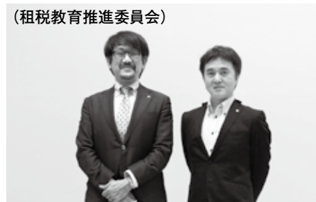
(租税教育推進委員会)

昨年は新型コロナ感染拡大により、小学校の租税教室は大幅に減少しました。しかし今年度は、小学校6年生における公民的分野の学習が1学期に変更になった関係で、以前は我々の繁忙期にあたる1月～2月の開催が多かった小学校の租税教室が6月～7月となりました。より参加しやすくなると思いますのでぜひ未経験の方も積極的に委員にご応募ください。