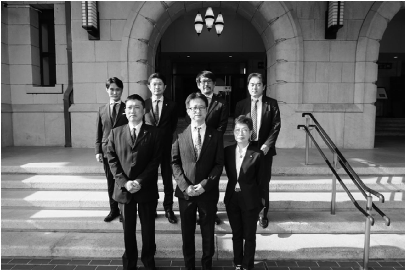
名古屋税理士会 昭和支部 第63回定期総会