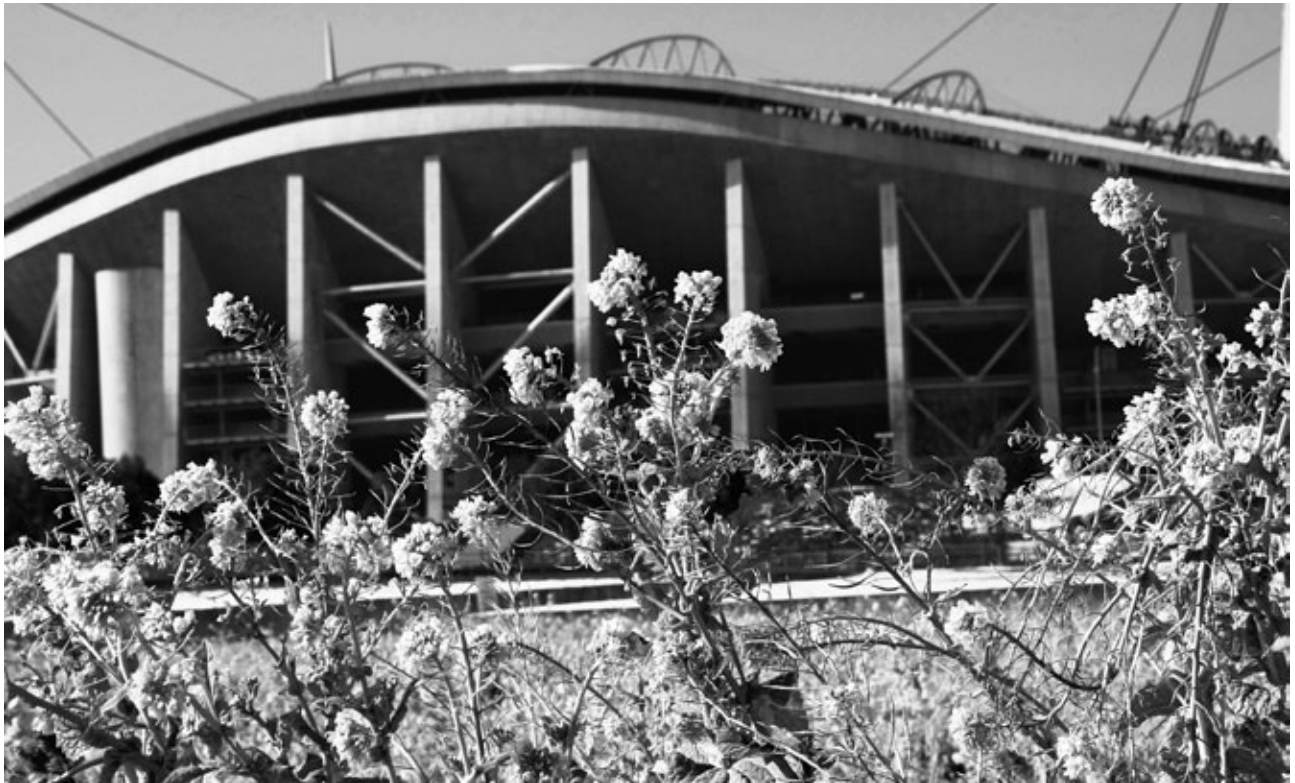
菜の花と豊田スタジアム