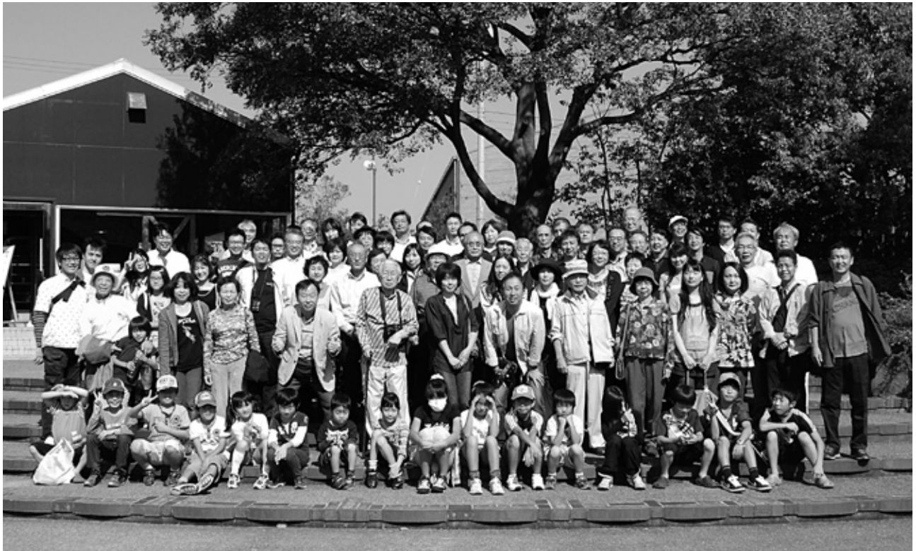
INAXライブミュージアムにて

発行責任者 支部長 鈴木 朋 宏 編集責任者 副支部長 鈴木 勝 発行所 名古屋税理士会昭和支部 印刷所 共生印刷株式会社