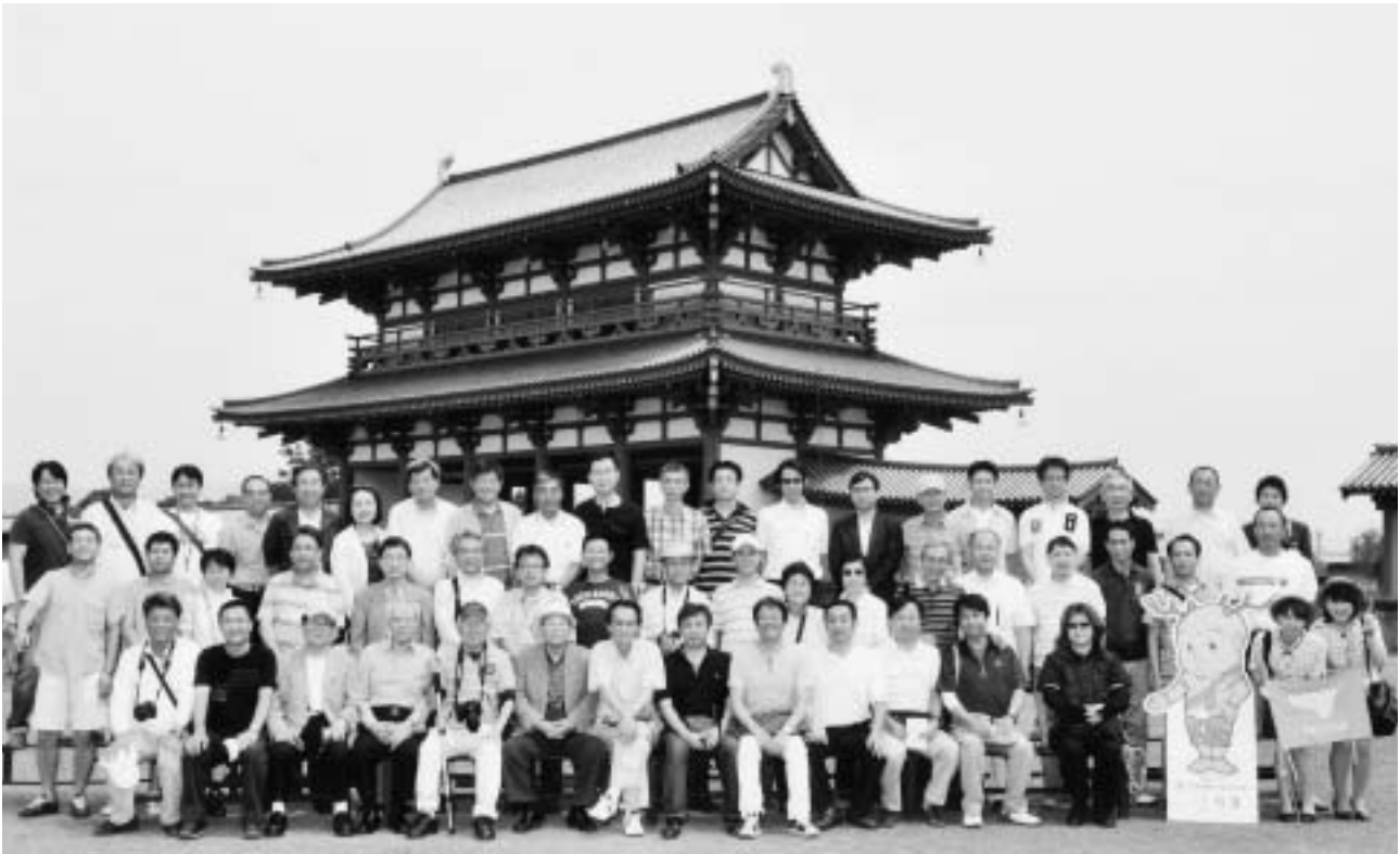
(平城遷都1300年祭 朱雀門)

発行責任者 支部長 米澤 健 編集責任者 副支部長 後藤 基文 発行所 名古屋税理士会昭和支部 印刷所 共生印刷株式会社