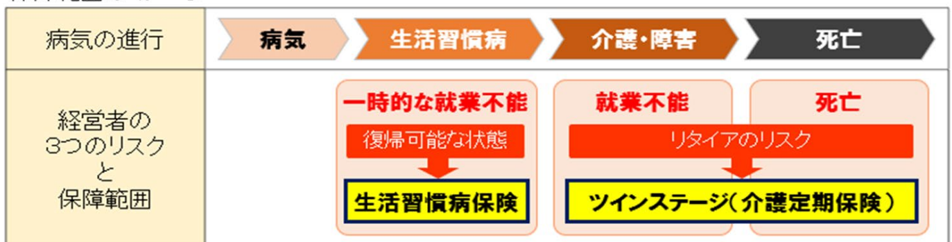
保障範囲のイメージ